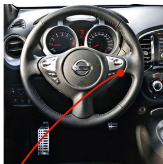
Разъем иммобилайзера на замке зажигания